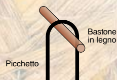
Particolare del picchetto di sostegno