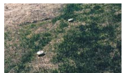
Prima fase di crescita della vegetazione

Il peso, le dimensioni della maglia e la resistenza possono essere definite a priori dal cliente, qualora vi siano i quantitativi sufficienti.