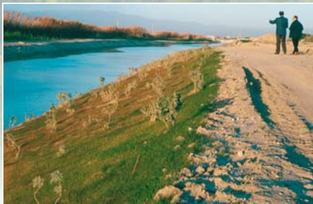
Protezione della sponda con Ecofelt