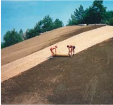
Posa del Biotessile

Il lato con il foglio di cellulosa viene rivolto verso il basso, a contatto con il terreno.