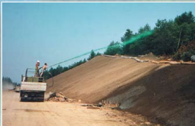
Operazione di idrosemina sulla scarpata

I Biofeltri Ecofelt oltre alle fibre normalmente impiegate includono anche trucioli di legno per aumentare la capacità di ritenzione idrica e rendere il materiale più aerato. Sono inoltre accoppiati ad una rete in juta e su richiesta anche ad un foglio di cellulosa. In fase di produzione su alcuni modelli vengono inclusi semi, concimi ed anche un ritentore idrico.