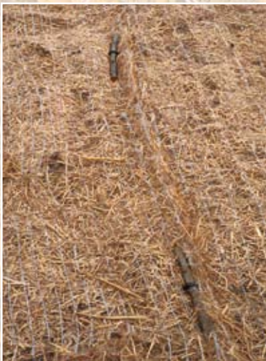
Particolare dei picchetti di fissaggio